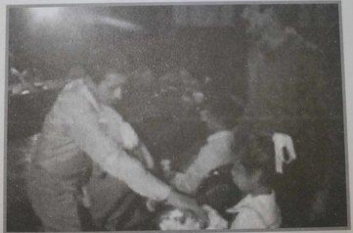
حسن مستشرق در حال گرفتن شاخه گل از هلا، دختر پنج ساله صدام حسین