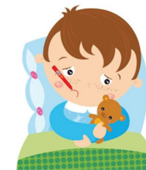
تب و بی حالی شایع است