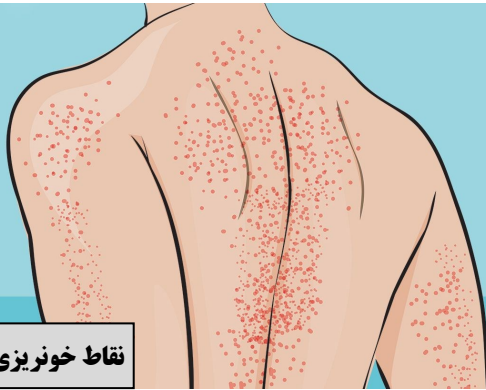
نقاط خونریزی سوزنی

تهیه و تنظیم: کارگروه آموزش سلامت بخش خون