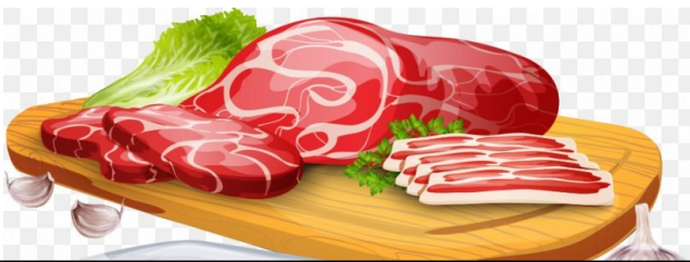
رژیم غذایی مناسب برای این کودکان، رژیم غذایی پر پروتئین می باشد.