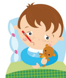
تب طولانی ز علامت های مهم می باشد