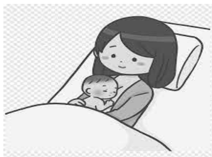
تصویر مراقبت آغوشی

با توجه به دستور پزشک نوزاد، به پهلو راست، چپ یا به شکم بخوابد.