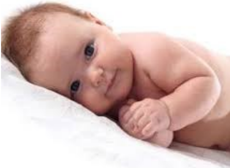
نوزاد به پهلو و سر در زاویه ۳۰ درجه

با توجه به دستور پزشک به پهلو چپ یا راست قرار بگیرد در حالیکه سر نوزاد ۳۰ درجه، بالا باشد.