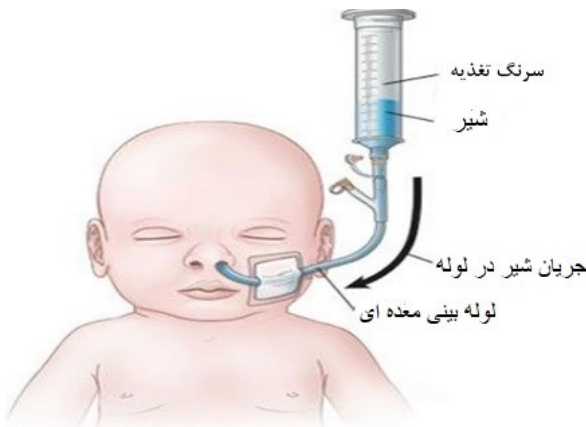
تغذیه با لوله بینی معده ای در شیرخوار

روزهای اول بستری با توجه به دستور پزشک به نوزاد شیر داده نمی شود و سپس با توجه به صلاحدید پزشک و با توجه به وضعیت بالینی نوزاد شیر ابتدا به صورت گاوآژ (لوله از بینی به معده) و سپس مستقیم از دهان با حجم کم با توجه به وزن و سن نوزاد شروع می شود.