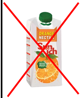
مصرف آبمیوه ممنوع

اجتناب از مصرف غذاهای چرب و حاوی مقدار زیاد قندهای ساده (آب میوه صنعتی، نوشابه های گازدار) و مواد غذایی حاوی سوربیتول (مانند آب سیب و هلو).