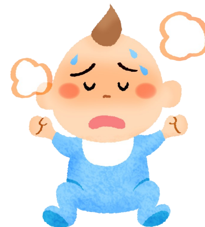
تب=دمای بالای ۳۷,۳درجه از طریق زیر بغل