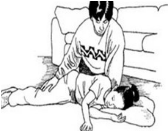
هنگام تشنج کودک را به پهلو قرار دهید و سرش را بچرخانید.