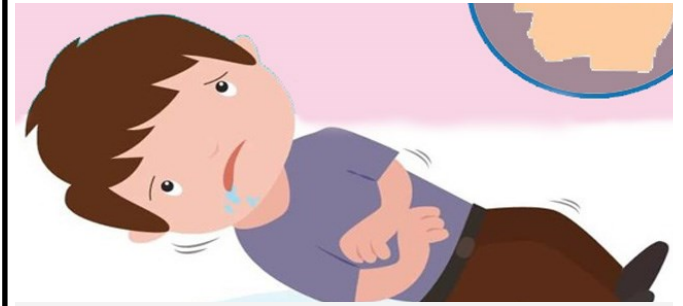
از علائم تشنج خروج بزاق از دهان، از حال رفتن و لرزش بدن می باشد.

تشنج اختلال در فعالیت الکتریکی مغز است و نشانه تشنج بستگی به محل این اختلال در مغز دارد که علائم آن ممکن است شامل عدم آگاهی کودک شما از محیط (مانند غش کردن)، حرکات غیر ارادی (مانند لرزش بدن)، رفتارها (مانند خیره شدن چشمان کودک)، احساسات یا وضعیت بدن (مانند انقباض عضلات) باشد.